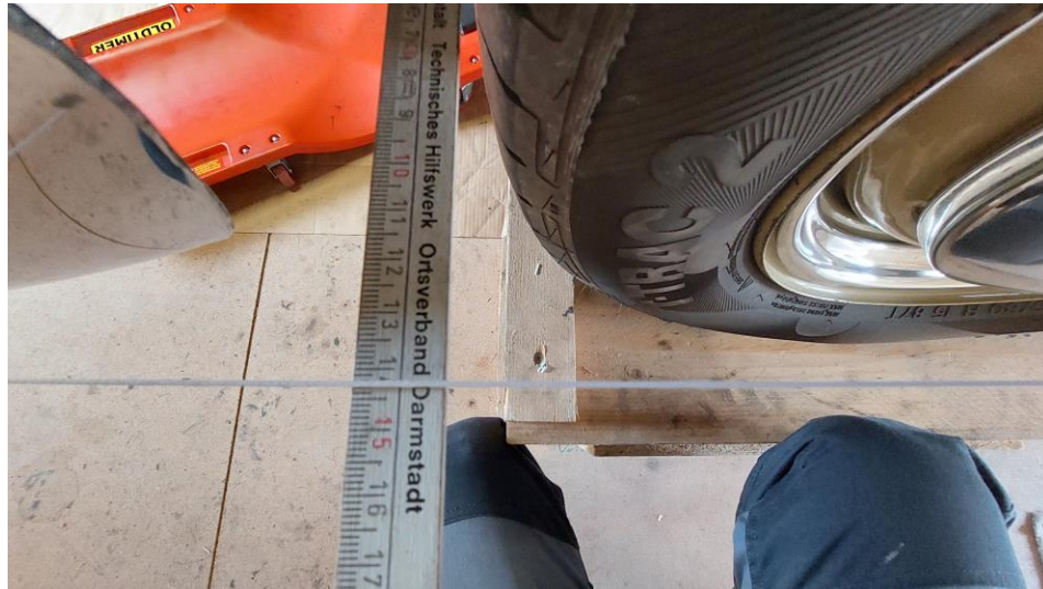
Messen vor dem Rad